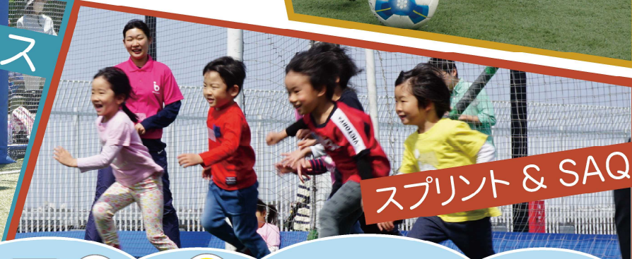
スプリント & SAQ