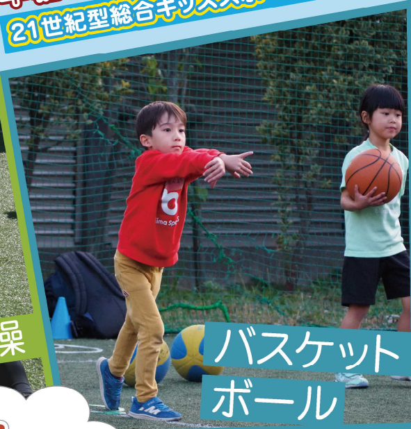
バスケット ボール